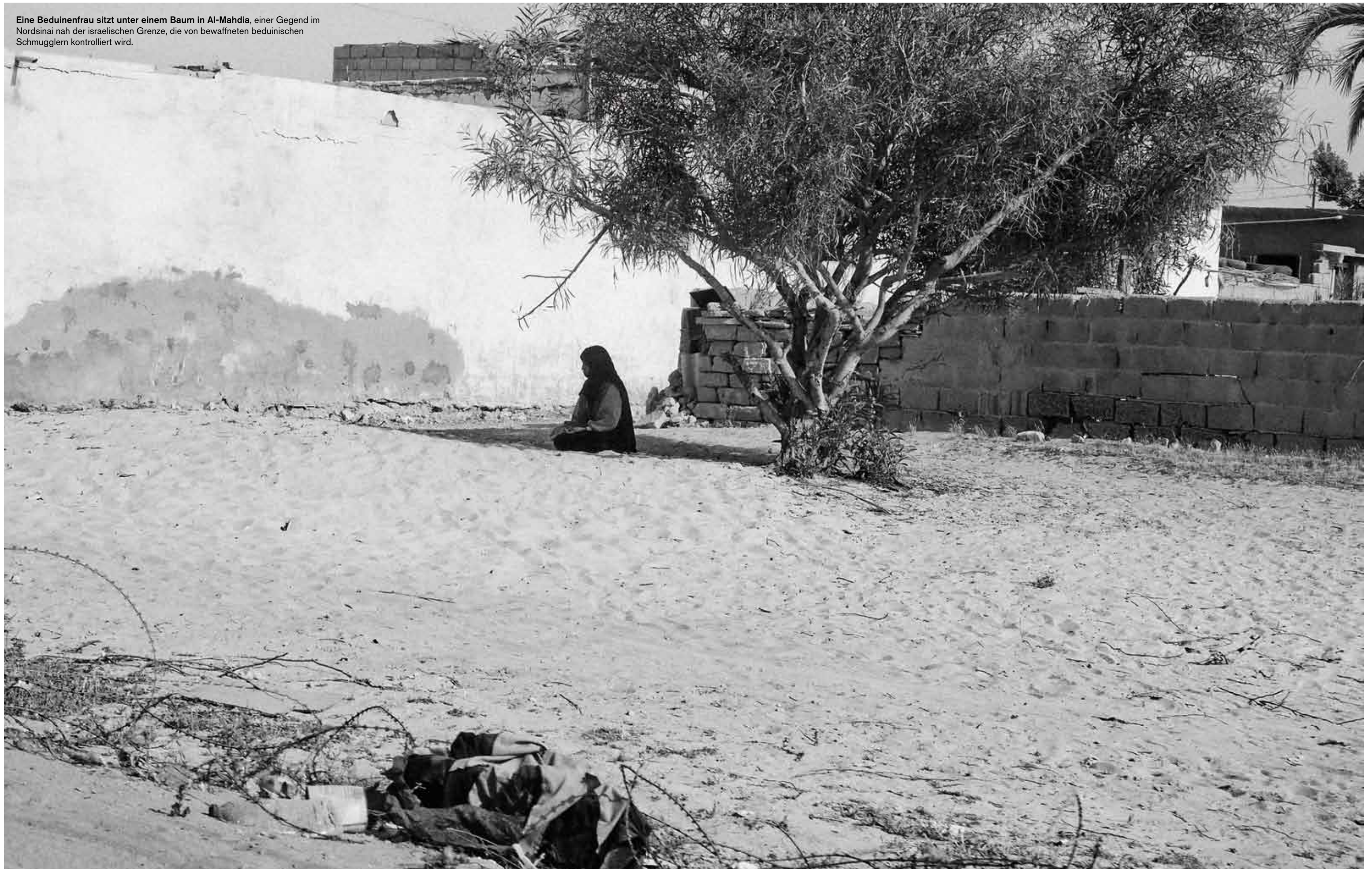
Eine Beduinenfrau sitzt unter einem Baum in Al-Mahdia, einer Gegend im Nordsinai nah der israelischen Grenze, die von bewaffneten beduinischen Schmugglern kontrolliert wird.