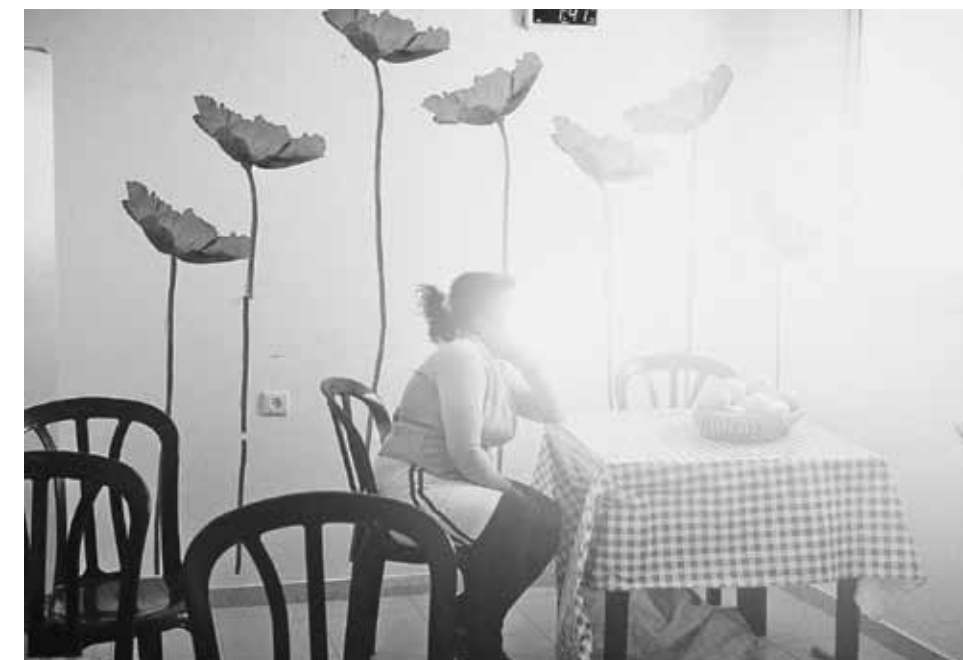
Oben: Mohnblumen an der Wand, Obst im Korb, Plastik um sie herum. In Tel Aviv ist Weini, 25, immerhin sicher, erkannt werden will sie dennoch nicht. Wie fast alle Flüchtlinge aus Eritrea hat sie in Israel kaum eine Perspektive.

Und der Organhandel? »Bullshit!«, braust er auf. »Staub, Hitze, die große Entfernung nach Kairo – wie soll das funktionieren?« An mobile Kliniken, die selbst für die Beduinen unsichtbar in der Wüste operierten, glaubt er