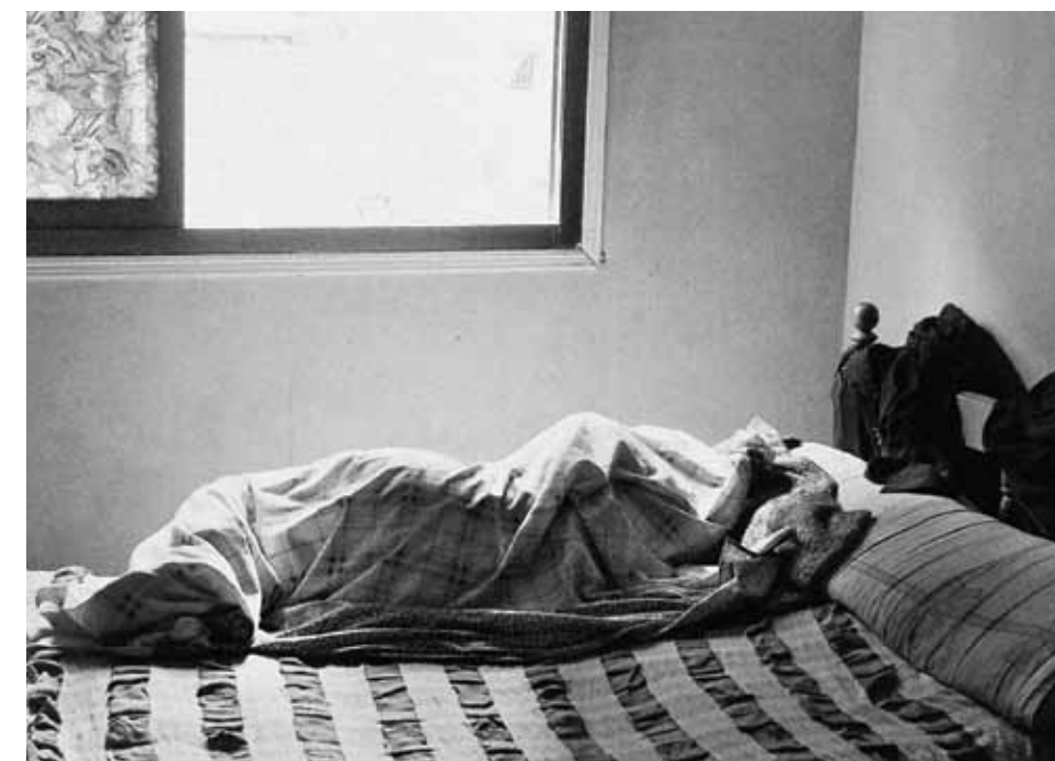
Unten: Auch in Kairo gibt es geschützte Häuser für Gefolterte. Dieser Mann schläft in einem Haus in der Nähe von Gizeh.

Wer kein Geld hat, tauscht drei Geiseln gegen einen Toyota oder sieben gegen einen Lastwagen