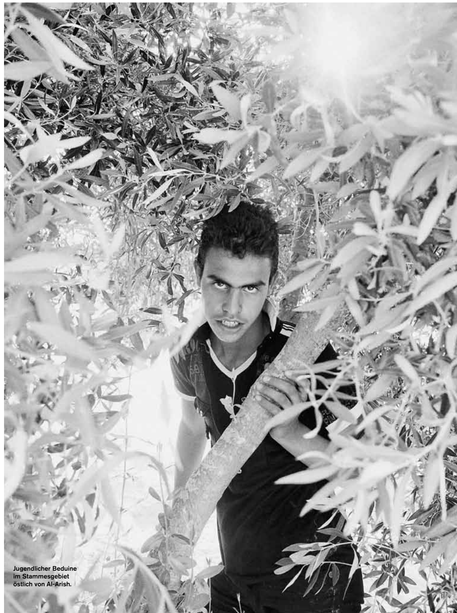
Jugendlicher Beduine im Stammesgebiet östlich von Al-Arish.