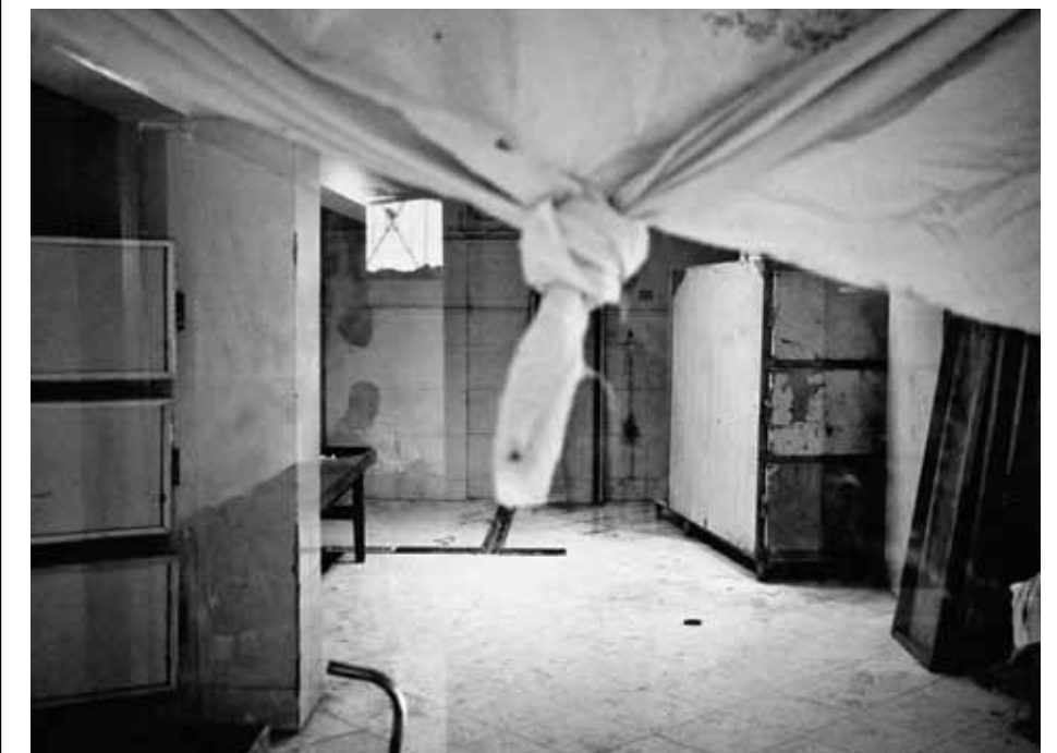
Al-Arish, Ägypten: Die Leichenhalle des örtlichen Krankenhauses, wo viele tote Afrikaner liegen und für die Beerdigung vorbereitet werden.

nicht. Überlebende der Foltercamps berichten zwar von einem Mann mit weißem Kittel und Arztkoffer, den die Kidnapper ihren Geiseln vorführen, um ihnen dann zu drohen: »Wenn eure Familie nicht zahlt, schneidet der Doktor eure Nieren raus.« Aber selbst gesehen hat einen Organraub niemand. Vielleicht ist die Drohung eine perfide Psycho-Folter, um