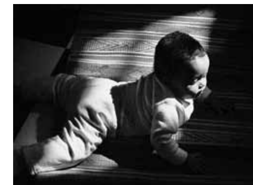
Ein krabbelndes Baby im Frauenzentrum von Tel Aviv.

wird der Zutritt verwehrt. Mit der Begründung, die ehemaligen Geiseln der Beduinen seien Wirtschaftsflüchtlinge, damit illegal im Land und ohne Anspruch auf politisches Asyl.