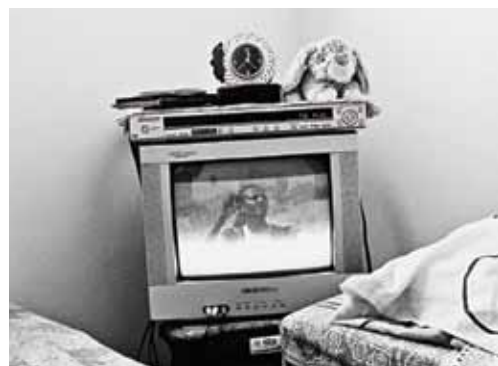
Auf dem Fernseher in Sebles Zimmer stapeln sich ihre Habseligkeiten , auf dem Bildschirm laufen Musikvideos aus dem eritreischen Fernsehen.

Stahlzauns fertiggestellt, der sich entlang der Grenze zu Ägypten von Eilat an der Nordspitze des Roten Meeres bis nach Gaza zieht und afrikanische Flüchtlinge aus dem Sinai fernhalten soll.