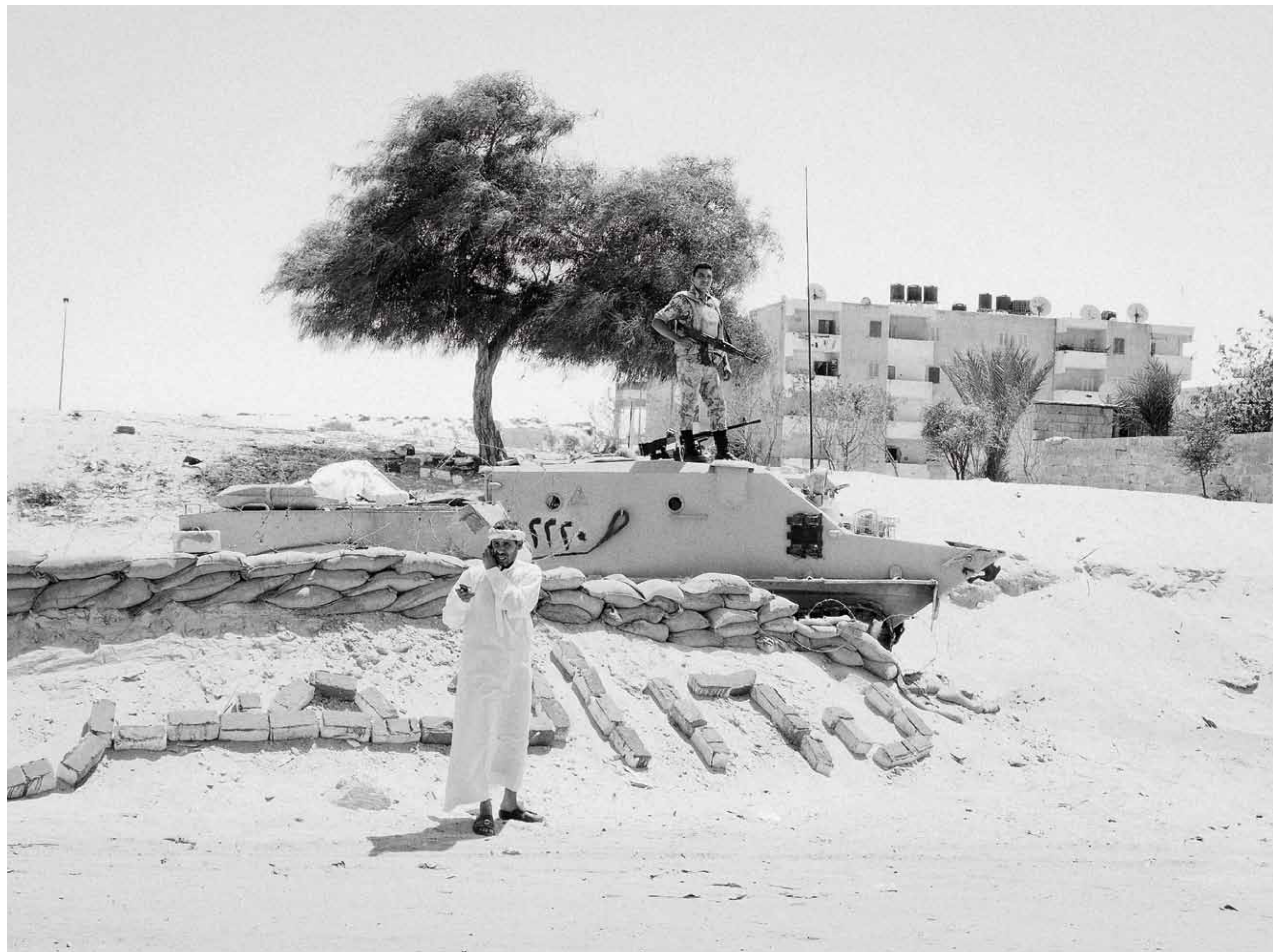
Al-Arissa-Checkpoint, Nordsinai, Ägypten: Ein Beduine telefoniert vor einem Posten der ägyptischen Armee im Randgebiet von Al-Arish.